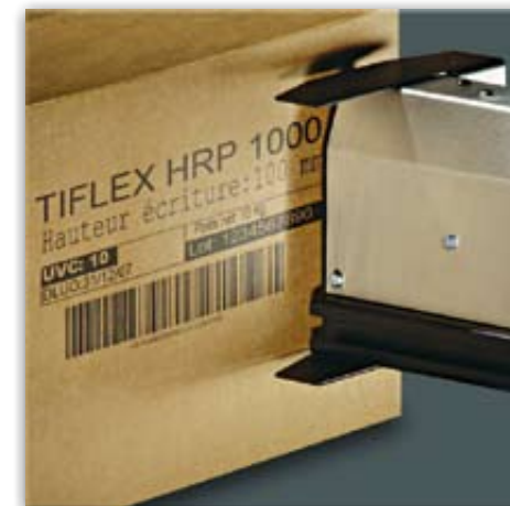
Imprimante Très Haute Résolution HRP 1000